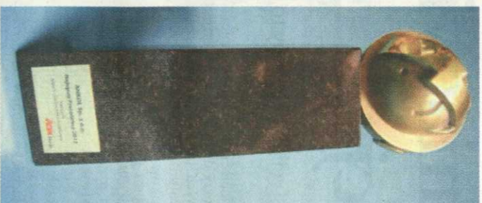
Nagroda „Najlepszy Pracodawca 2012”

– Korzystając z okazji, chciałbym serdecznie podziękować tym wszystkim gentiom, któ-